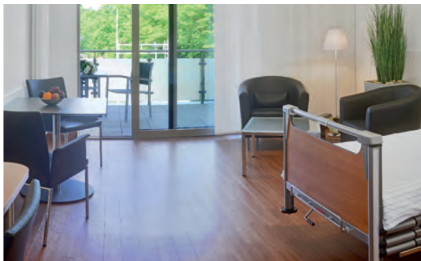
Bild eines unserer Wahlleistungszimmer. Reservierungen sind nicht möglich.

Der mit der Inanspruchnahme des Wahlleistungsangebots verbundene Zimmerzuschlag beinhaltet nicht nur die Bereitstellung des Zimmers, sondern bietet Ihnen darüber hinaus die Möglichkeit, die nachfolgenden Serviceleistungen kostenlos in Anspruch zu nehmen.